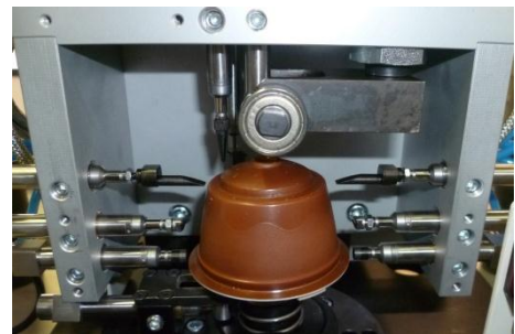
Figure 2 – Capsule disposée sur sa plaque tournante et palpeurs de mesure